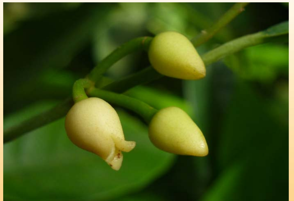
Blüte des Muskatnussbaumes.