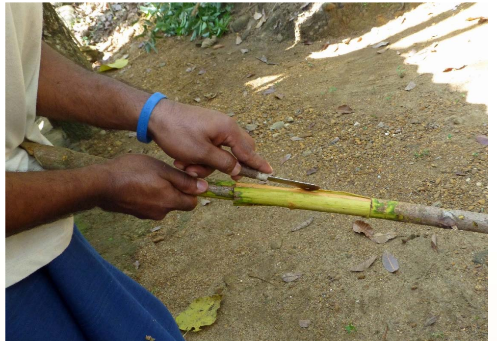
Schälen der Zimtrinde.

Bei unserer nächsten Sonntagsführung stellen wir, passend zur Weihnachtszeit, u.a. Zimt-, Muskat- und Pimentbaum sowie Ingwerstaude vor und die daraus gewonnenen Gewürze.